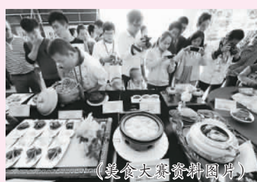
(美食大赛资料图片)