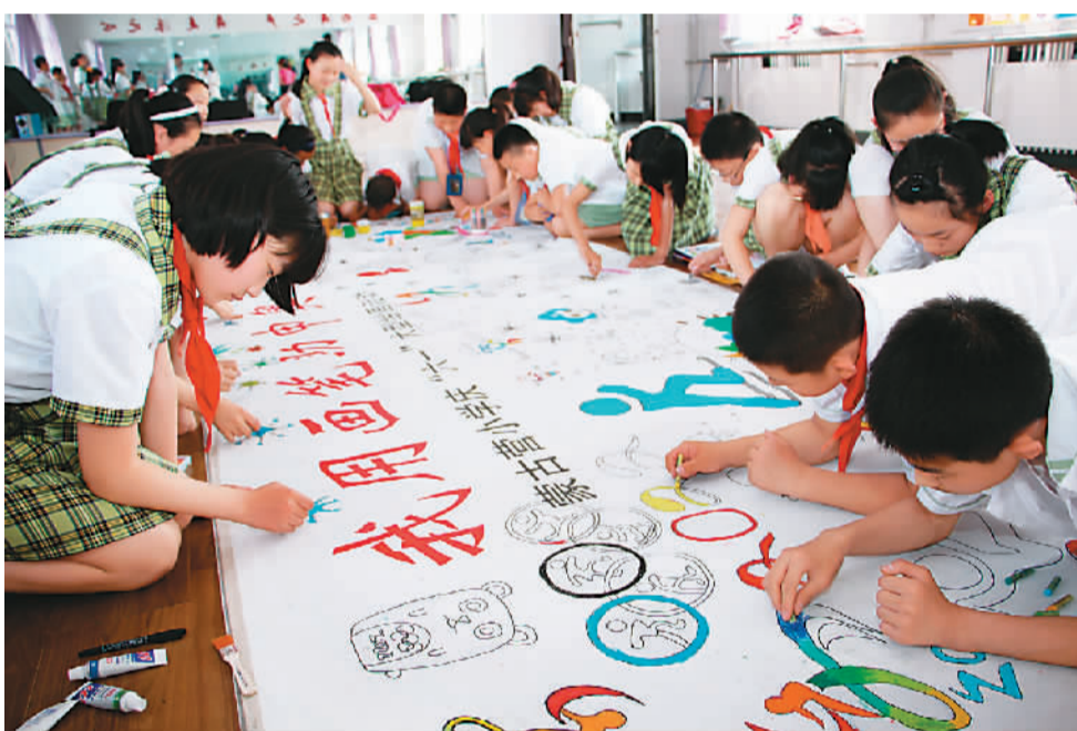
5月27日,河北省张家口市桥西区蒙古营小学举行“迎六一·红领巾助力中冬奥”长卷绘画制作活动。近100名小学生在20.22米的画卷上以绘画、书法的形式为北京张家口联合申办2022年冬奥会加油。