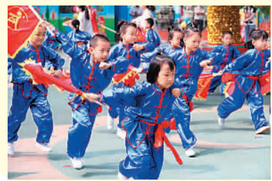
图为5月27日，北京市府大接楼幼儿园的小朋友们在表演武术《中国龙》。