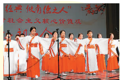
图为5月26日，府学胡同小学四年级七班的孩子们，穿着汉服，朗诵《诗经》，展现出中华传统文化之大美。