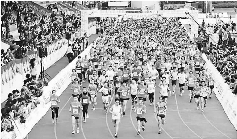
全城跃动 活力跑

两年一度的全港运动会(港运会)正在火热进行中,来自香港18个区的3205名运动健儿经过严格甄选和积极备战,在赛场大展身手。本届港运会为第五届,赛程从4月25日至5月31日,共设8个竞赛项目。