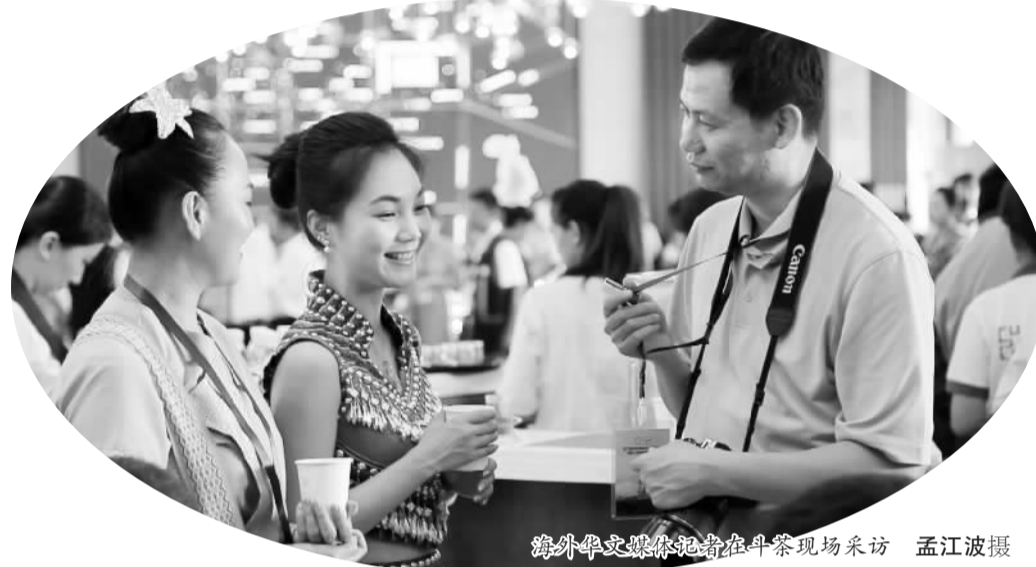
海外华文媒体记者在斗茶现场采访