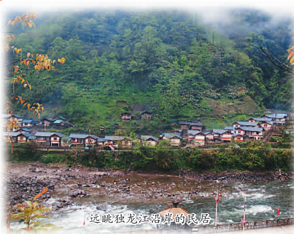
远眺独龙江沿岸的民居

在过去，每年10月到次年5月，大雪封闭了雪山垭口，这里便成了一个与世隔绝的地方。而如今，随着独龙江公路隧道的贯通，标志着独龙族同胞祖祖辈辈大雪封山半年的历史宣告结束。道路的畅通，不仅意味着独龙族人民“走出去”方便了，更意味着更多的外地游客会“走进来”，这山林深处的美景，将会被更多的人传扬。