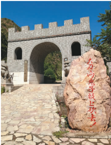
喜峰口雄关大刀园

本报电（闫姝婧）随着旅游的深入，旅游门店成为展示旅游服务的重要一环，门店服务升级提速势在必行。日前，民生旅游创办了京城首家大规模旅游体验店，采用一对一的咨询模式，并设有残疾人服务专区、LED观赏区、会员活动区、水吧等服务专区，有效地为消费者提供更具人性化的服务。该体验店集品牌展示及分享功能于一身，功能上具有很多创新之处，比如娱乐方面，“民生旅游”号列车穿梭在1:12的各大洲微缩景观中。同时，将海岛度假体验搬进了体验店内，让消费者提前享受度假乐趣。民生旅游体验店未来将把飞机上的座椅、国外著名景点相关的元素等引进店内，让游客有身临其境的感受。