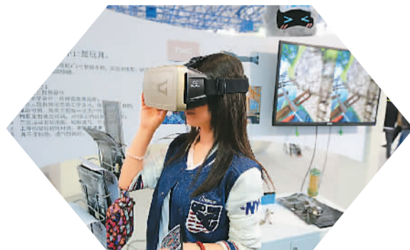
图为观众体验可用眼睛打字的虚拟现实智能眼镜。

首次参展科博会的阿里巴巴公司，对外展出了最新的“刷脸支付”技术，消费者在刷脸机前进行面部识别和扫描，只需一两秒钟，即可轻松完成支付。现场的工作人员介绍称，人脸识别技术是基于神经网络，让计算机通