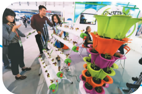
图为能够在阳台上安装、使用的梯式无土栽培设备。

“互联网带来的改变、效果很明显，比如红领服饰、尚品宅配等企业，用互联网化改造生产管理模式，以客户为驱动，在同行业负增长的情况下，这些‘触网’企业