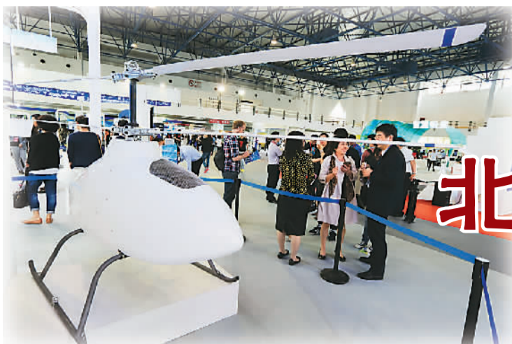
图为科博会展出的无人直升机。

5月17日，以“引领科技创新、推动产业发展”为主题的第18届北京科博会落幕。中国创造新高度、智能制造、高精尖、互联网+、经济新常态，成为本届科博会的最大看点。