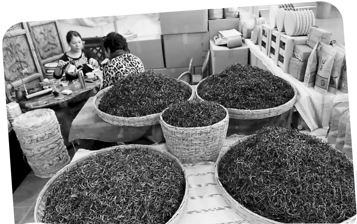
大图：茶博会现场一景。小图：参展商冲泡普洱茶。