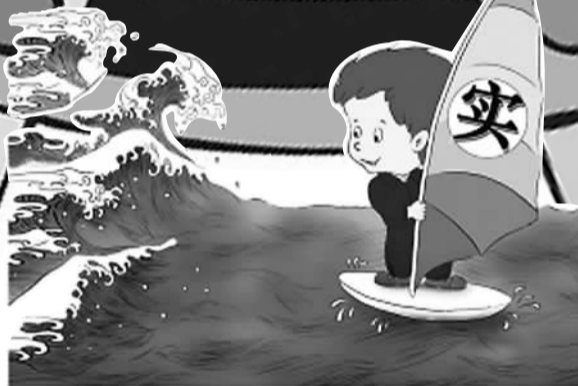
谋事要实 作者 吉建芳

本报整理了目前已出炉的22个省(区、市)委书记在“三严三实”专题党课上的讲话,看看这些各地“一把手”的“讲义”里,是如何讲解“三严三实”的。