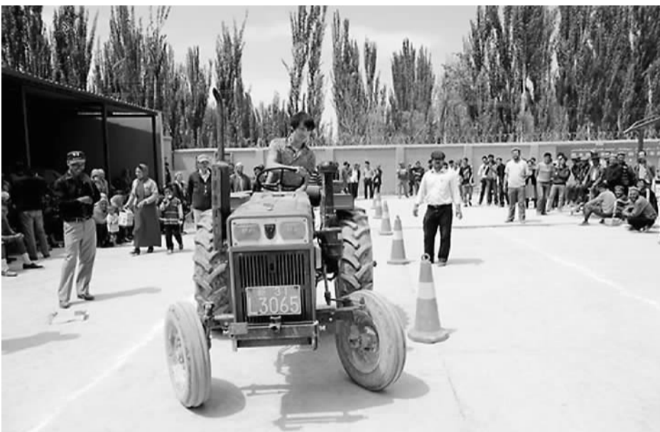
▲开上拖拉机比技能