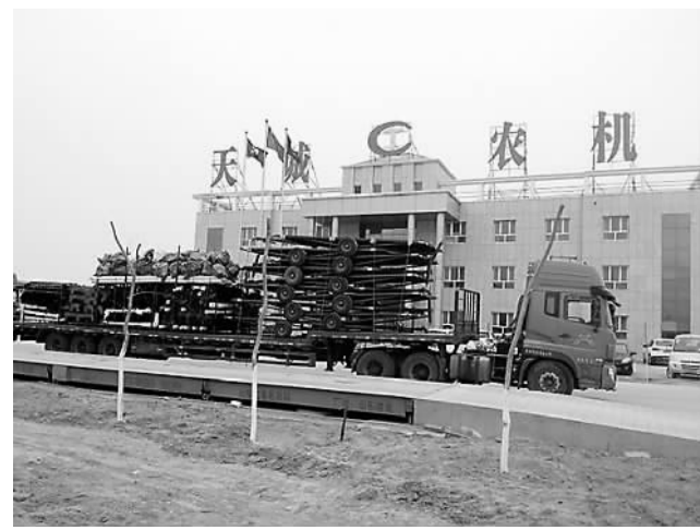
▲图为新疆兵团29团天诚农机公司生产的精良棉花播种机正在装车，准备发往塔吉克斯坦。

格局。29团肩负现实的责任，将立足地理区位、交通、大漠旅游和军垦文化，传承丝路精神，弘扬丝路文化，重振丝路雄风，抓住产业援疆、西部大开发、东部产业转移等战略机遇。在未来5至10年，实现29团产业发展全面升级，将团场建设成为南疆地区先进生产力和先进文化的示范区。“借助‘一带一路’的愿景与行动”，推动团场各方面的发展，29团要用实际行动加快推进丝绸之路经济带建设，绘就恢宏蓝图。”张永平说。