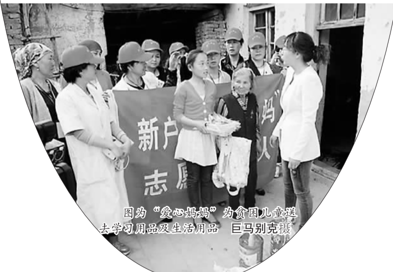
图为“爱心妈妈”为贫困儿童送去学习用品及生活用品

虽然“爱心妈妈”给贫困儿童带去的物资不多，但她们的行动足够温暖人心。她们用实际行动展现巾帼靓丽风采，用母性和慈爱庇护贫困儿童，用爱心和关怀爱戴孤寡老人，用责任和道义温暖着一个最需要关爱的群体。