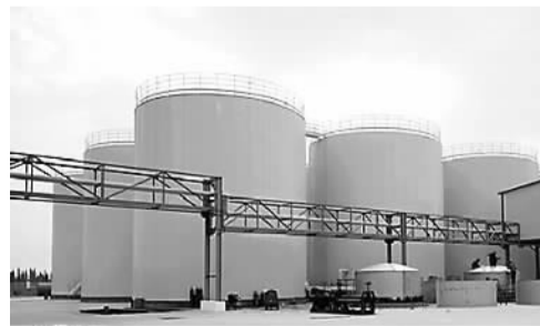
▲图为西北首家达到国家和欧洲标准生物柴油的生产厂家——29团澳华油脂公司一角。

近日，新疆维吾尔自治区党委理论学习中心组在就国家“一带一路”建设进行集中学习时，中共中央政治局委员、自治区党委书记张春贤强调，要深刻领会国家“一带一路”建设的意义，深刻认识新疆作为丝绸之路经济带核心区的特殊地位和作用，做好自身发展和向西开放两篇文章，做好核心区建设和“五大中心”建设，全面支持新疆企业“走出去”，用实际行动加快推进丝绸之路经济带建设。