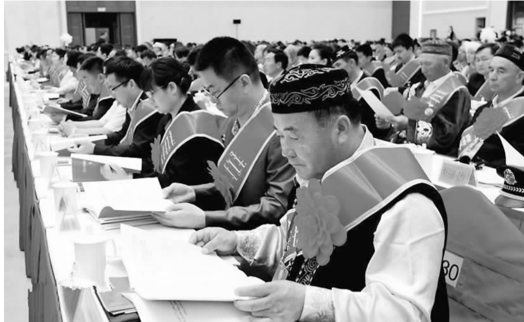
图为参加新疆民族工作会议暨第七次民族团结进步表彰大会的代表。

张春贤指出，做好新形势下新疆的民族工作，最根本、最核心的就是坚持中国特色解决民族问题的正确道路，处理好三个关系，把握好三个问题。处理好三个关系是指处理好民族工作与全局工作的关系、处理好民族工作与宗教工作的关系、处理好物质力量与精神力量的关系。把握好三个问题是指坚定不移贯彻执行党的民族政策，坚持和完善民族区域自治，旗帜鲜明地反对民族分裂、维护祖国统一。张春贤在会上同时强调，要全力促进各民族交往交流交融，要坚持以现代文化为引领，要紧贴民生推动跨越式发展，要着力提高依法管理民族事务能力。