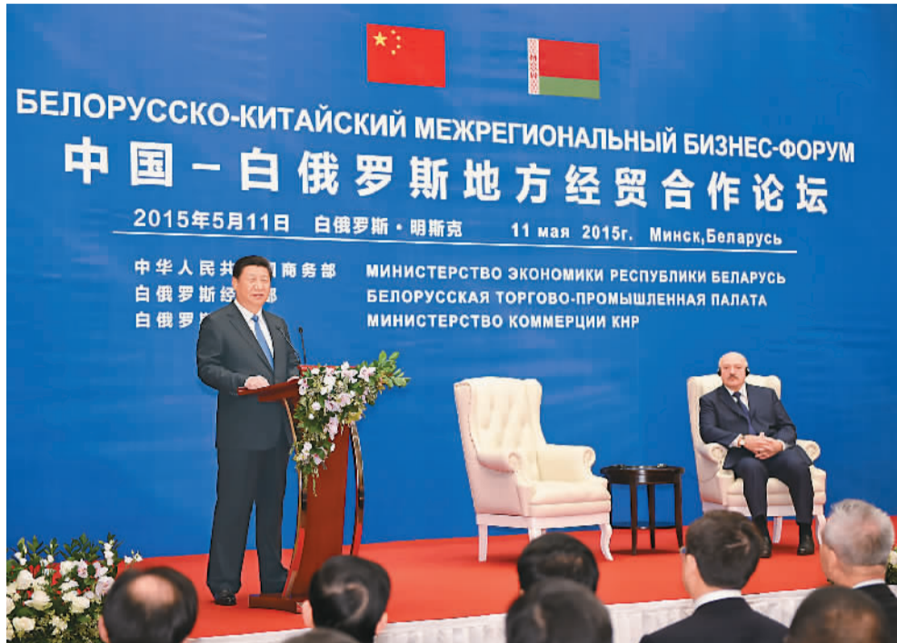
图为习近平同卢卡申科共同出席开幕式并致辞。

本报明斯克5月11日电 (记者杜尚泽、林雪丹) 中国—白俄罗斯地方经贸合作论坛11日在明斯克开幕。国家主席习近平同白俄罗斯总统卢卡申科共同出席开幕式并致辞。来自中国北京、黑龙江、浙江、广东、江苏、湖北、四川、甘肃等8个省市负责人和白俄罗斯明斯克市、明斯克州、布列斯特州等7个州、市行政长官参加论坛。