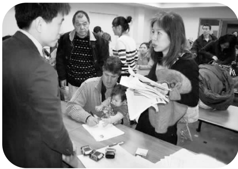
中国驻美大使馆工作人员来到田纳西州纳西维尔市为当地华人服务,解答相关咨询

在领事官员的耐心解释下,我终于明白,委托书公证是对我们个人合法权益的一种保障,领事官员的见证可以