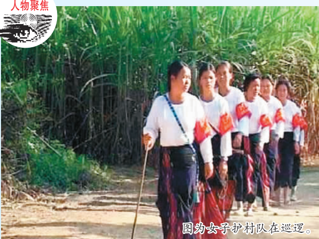
图为女子护村队在巡逻。