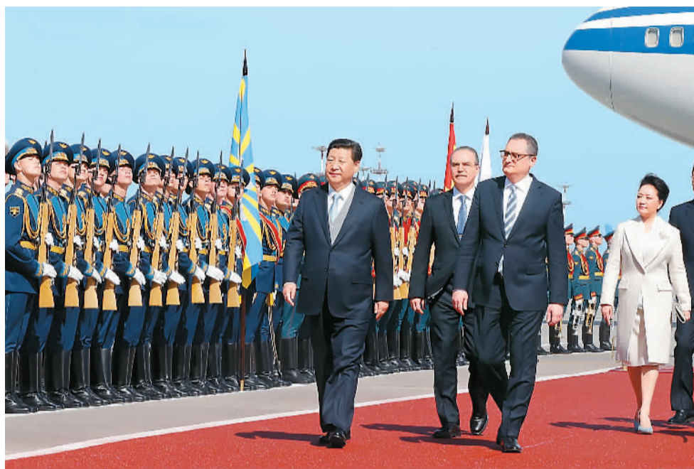
图为俄罗斯政府在机场举行欢迎仪式，习近平检阅俄罗斯三军仪仗队。