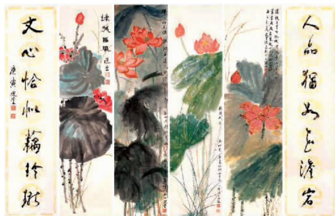
荷花四条屏 饶宗颐

饶宗颐是中央文史研究馆馆员、香港大学荣休教授，在古文字学、敦煌学、考古学、金石学、史学、文学、宗教史等方面成就卓著，被誉为“通儒”、“国际瞩目的汉学泰斗”、“整个亚洲文化的骄傲”。