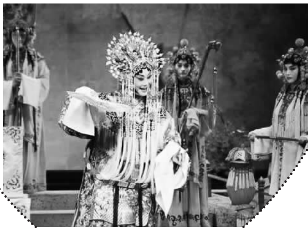
梅葆玖演出《贵妃醉酒》

很多人认为，梅兰芳已经将梅派艺术发展到顶峰，作为儿子的梅葆玖自然会有一种名门之后的无形压力。然而梅葆玖却完全没有这么想，在他看来，他只是个干活的人、一名演员，而非人们口中的大师。能把父亲的艺术传承下去，轻松享受戏曲之乐，就足够了。