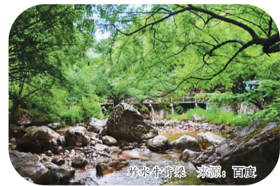
柞水牛背梁

讯等基础设施和幼儿园、卫生室、体育器材等公共服务配套项目。与此同时，柞水县还把搬迁群众权益维护作为后续管理工作的重中之重，通过成立物业服务公司，为搬迁户提供全方位的物业服务，保障搬迁户权益。