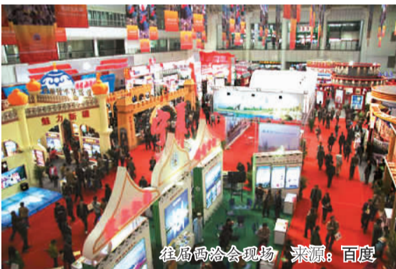
往届西洽会现场