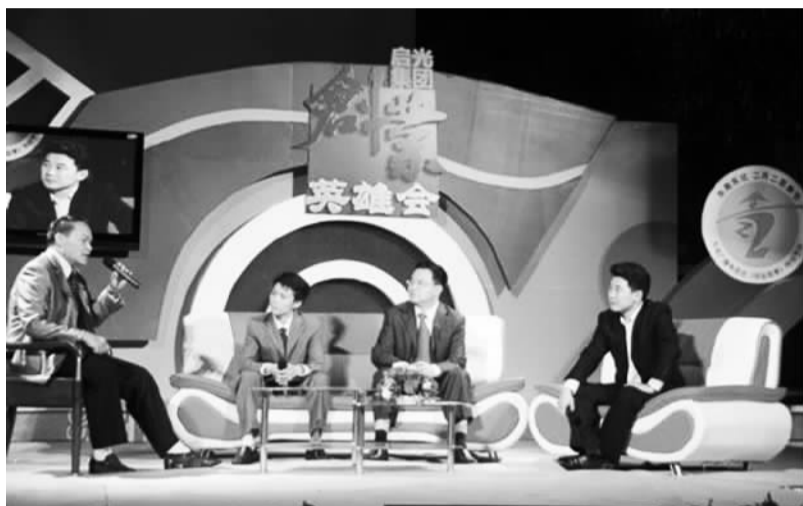
《创业英雄汇》节目现场

如今，越来越多的海归创业者出现在公众视野中，海归创业故事层出不穷。从学员、项目到前期准备、项目发布，再到投资评估和项目运营，创意和卖点赚足了大众眼球。海归创业逐渐从“幕后”走向“台前”，这种方式使海归获得创业新机遇。