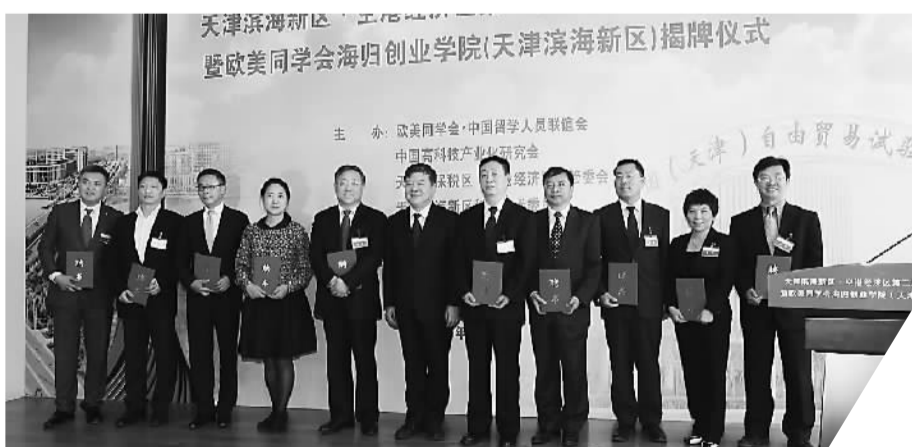
海归创业学院首家地方学院在津揭牌

虽然海归创业学院网络学院目前还在探索当中，但其基本框架已经浮出水面，“互联网+”的模式也日臻成熟。线上与线下相结合，有效的传播方式让回国创业的留学人员更加方便快捷地了解国内创业环境，最大程度地节省人力、物力、财力。