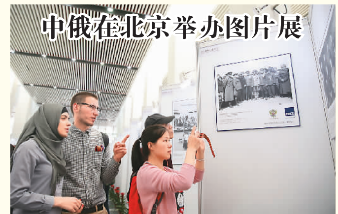
中俄在北京举办图片展

活动中，美国、德国等几十个联合国会员国及欧盟等地区组织代表也作了发言，强调维护《联合国宪章》宗旨和原则的承诺。