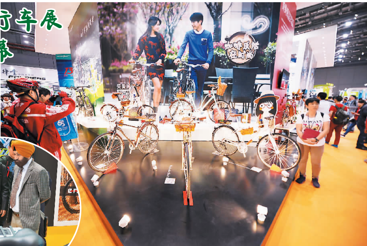
采购商在捷安特展厅参观。