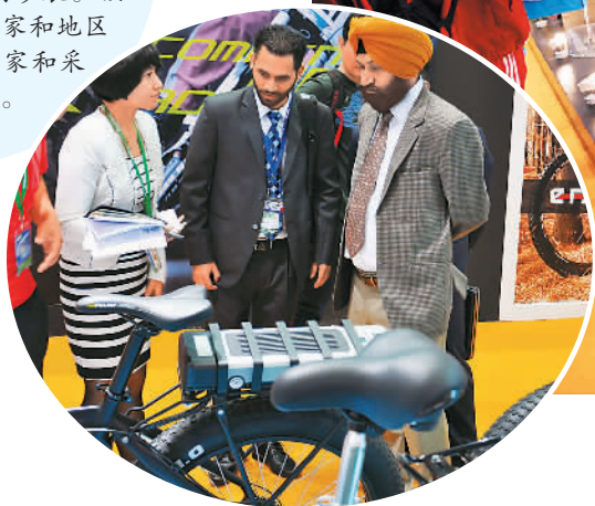
外国客商在展台前咨询。

5月6日，由中国自行车协会主办的“第二十五届中国国际自行车展览会”在上海国家会展中心拉开帷幕。展会将持续4天，来自世界各地的1315家展商参展。预计将有来自85个国家和地区的约12万专业买家和采购商来到现场。