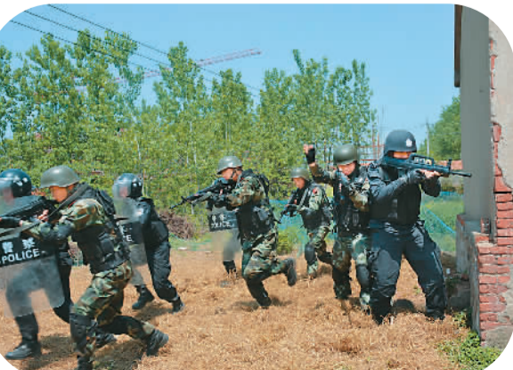
武警安徽省总队滁州市支队特战队员日前联合驻地公安特警开展以抓捕嫌犯、解救人质为主题的专项演习，以提高各种突发事件处置能力，确保“五一”小长假期间驻地安全稳定。