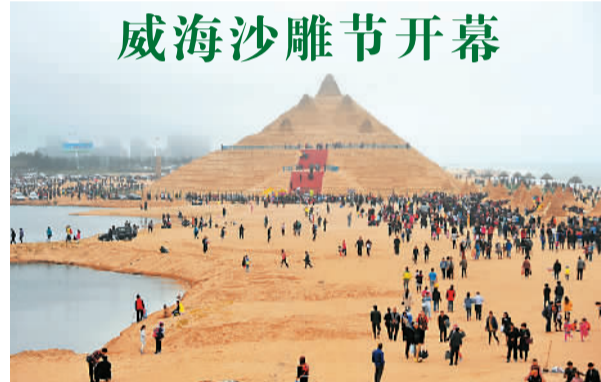
5月1日，第八届山东威海沙雕文化艺术节开幕。今年沙雕节由世界反法西斯战争暨中国抗日战争胜利70周年纪念、动作武侠、科幻魔幻、动漫动画、喜剧等五个板块组成。

本报电（王璐颖、赵南飞）经国务院批准，5月1日起，湖北省武汉天河机场口岸正式实施“外国人72小时过境免签”政策。届时，来自俄罗斯、美国、英国、法国、加拿大等51个国家，持有72小时内确定日期、座位前往第三国联程机票的外国人，将不用另外申请签证。武汉成为中部6省目前唯一获准实施该政策的城市。 为了让过境免签旅客享受到优质、高效、专业和通关服务，武汉边检站在天河国际机场出境入境大厅设置了中、英、法、俄4国文字引导标识和72小时过境专用通道，并在边检候检区域右侧放置中英文对照的外国人入境卡和72小时过境免签提示卡。