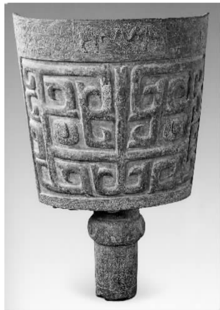
铜铙——中国最古老的打击乐器，目前发现的商代最大的象纹大铜铙