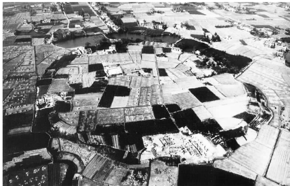
澧县城头山遗址，这是中国最早的古城遗址，在这里还发现了世界上最早的水稻田