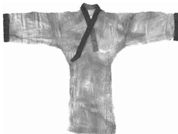
中国现存最早、最薄的纺织珍品——素纱襌衣。即便在现代，研究人员经过20年的努力，才终于织成了外观、色彩、质感与原物一模一样的仿制品，但重量依旧比原物重了0.5克。(马王堆汉墓出土)