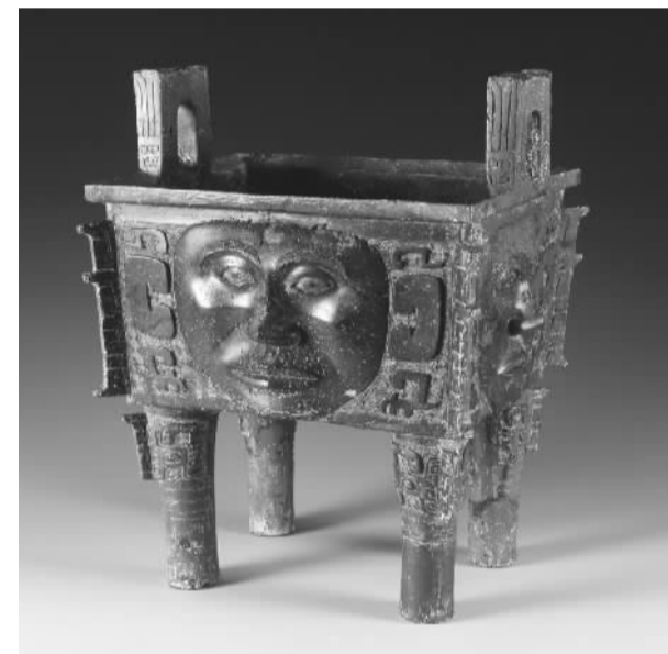
现有商周青铜器中唯一一件以人面为饰的方鼎——人面纹青铜方鼎