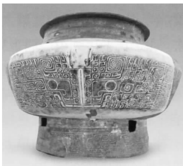
商周青铜甬王——兽面纹青铜甬