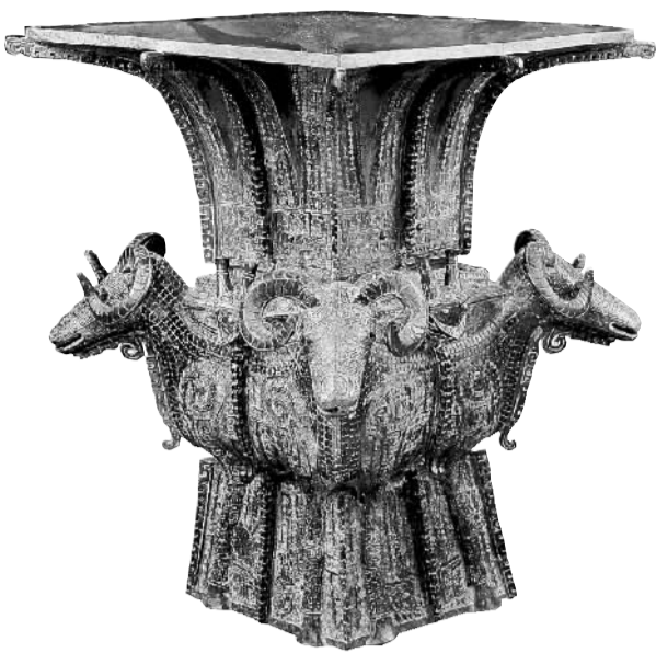
中国现存商代青铜方尊中最大的一件——四羊方尊，长沙宁乡出土，现存中国国家博物馆