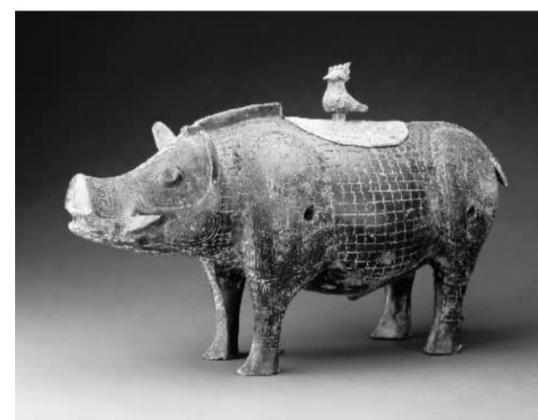
独一无二的青铜猪尊——青铜豕尊