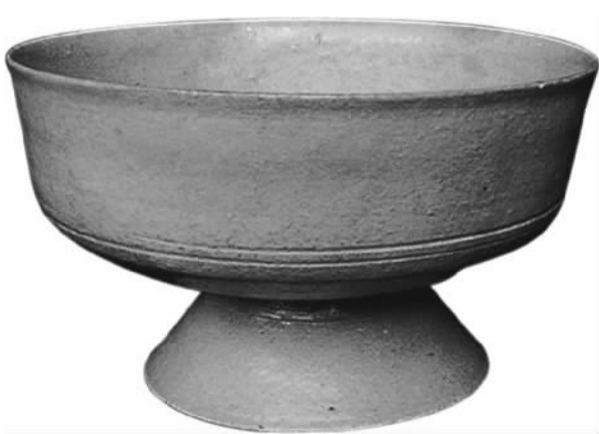
中国存世最早的白瓷实物——白瓷豆，烧制于东汉时期。“豆”，是一种用来盛放食物的器皿