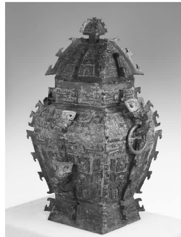
商周青铜器中的方罍之王——皿方罍。它曾经盖身分离，器身流落国外，湖南省经过多方努力，去年终于让它在故乡湖南成功合体，目前藏于湖南省博物馆