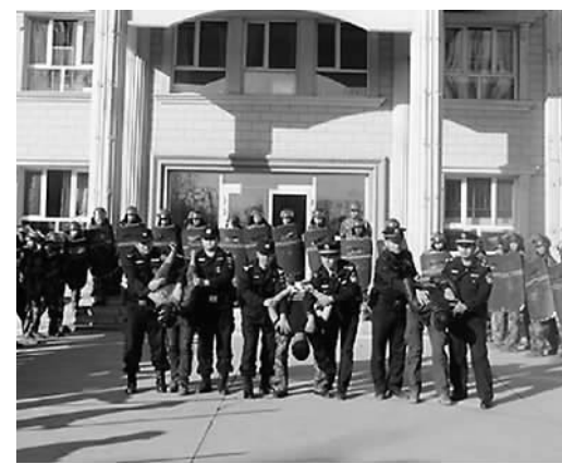
兵团第九师平安联防演练现场

该连采取单兵与班组、分层与分级、边教边学与评教评学相结合的方法，重点对处置突发事件进行实战化演练，特别邀请武警中队多名教官现场教学，有效地提高民兵队伍军事技能。