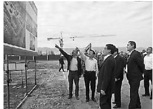
张家港援建工作人员与巩留县委工作人员共同规划巩留发展蓝图

移植张家港阵地建设和党建项目化管理的经验，打造巩留党建示范点。张家港市为巩留乡镇场基层武装部、公安基层所队、少数民族村级文化站、远程教育中心站点、基层党建办“五大基层阵地”资助基础设施、办公设备等，实现基层基础功能明显提升。