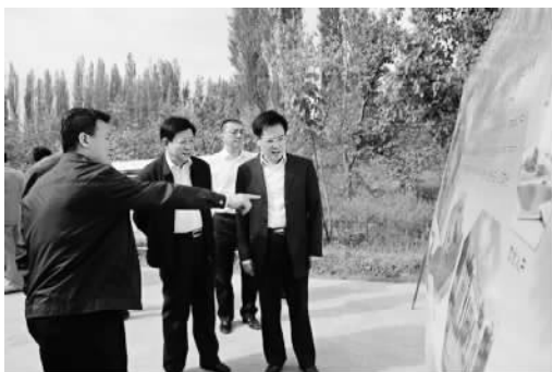
巩留县委领导与张家港援疆领导共同商讨发展计划

新疆天山申报世界自然遗产成功后，作为新疆天山申遗组成地之一的库尔德宁片区让巩留县声名大噪，得到了更多的关爱。