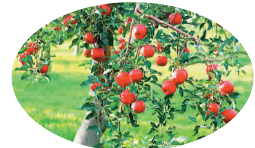
长武县做优苹果产业。

着眼于优化政治生态，落实从严管党要求。 长武县全面履行党风廉政建设“两个责任”，加强思想理论武装，匡正选人用人风气，抓好基层党建工作，坚决查处各类违纪违法问题，营造弊绝风清的政治生态。