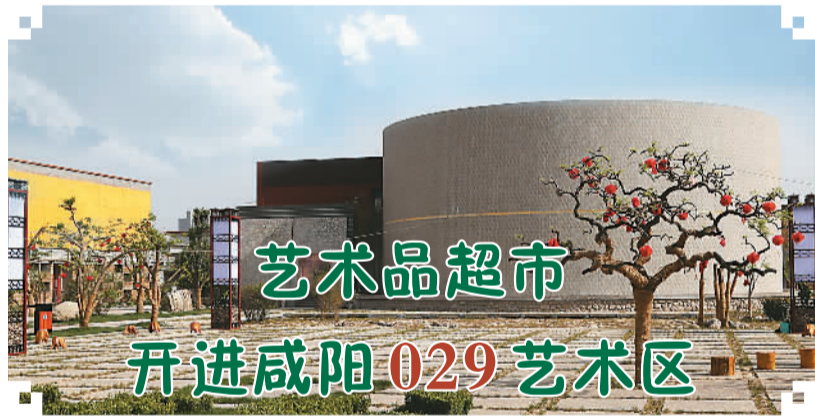
艺术品超市 开进咸阳029艺术区

方玮峰透露，今年陕西省将继续开通7条国际航线，争取让中国和新加坡第三个政府间合作项目落户西安。与此同时，一项国家级的“一带一路”平台近期也将落户西安。（吴绍礼）