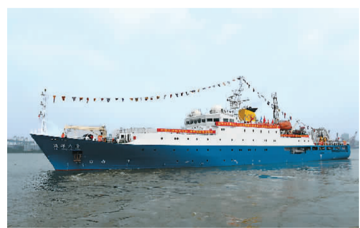
4月28日,中国科考船“海洋六号”从广州东江口海洋地质专用码头起航,远赴太平洋,执行为期200天的中国地质调查局深海资源调查航次和中国大洋第36航次科学考察任务。