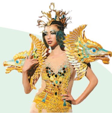
4月24日,2015上海国际服装文化节闭幕盛典暨“时尚·艺术·设计”大赛颁奖典礼在上海商城剧院举行。大赛共展示了80多套由青年设计师创作的服饰。图为模特在走秀。