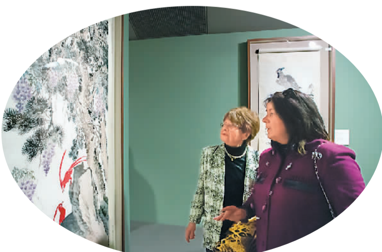
“天然之趣——北京画院藏齐白石精品展”4月23日在布达佩斯匈牙利民族画廊开幕。这次展览汇集了北京画院珍藏的108件齐白石的绘画作品,展现了齐白石丰富而传奇的艺术人生。“齐白石艺术国际研究中心匈牙利中心”揭牌仪式当日也在匈牙利民族画廊举行。