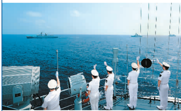
当地时间4月24日,完成联合护航任务的中国海军第十九、二十批护航编队在亚丁湾B点附近海域分航。