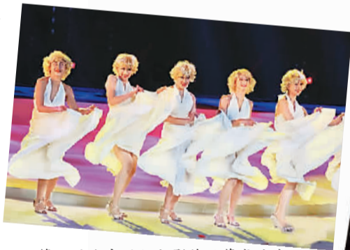
第五届北京国际电影节开幕式演出

郑泰成认为，要想做成功合拍片或者合作，“相互理解和对于对方文化的尊重是一个起点，因为每一个国家都有自己做电影的方式，不是说哪个国家的方式是正确的。你要尊重他们，之后去相互理解，然后形成一个很好的协同效应。当然，现在的合拍还处在一个初级阶段，我们的合作还有很长的路要走。”