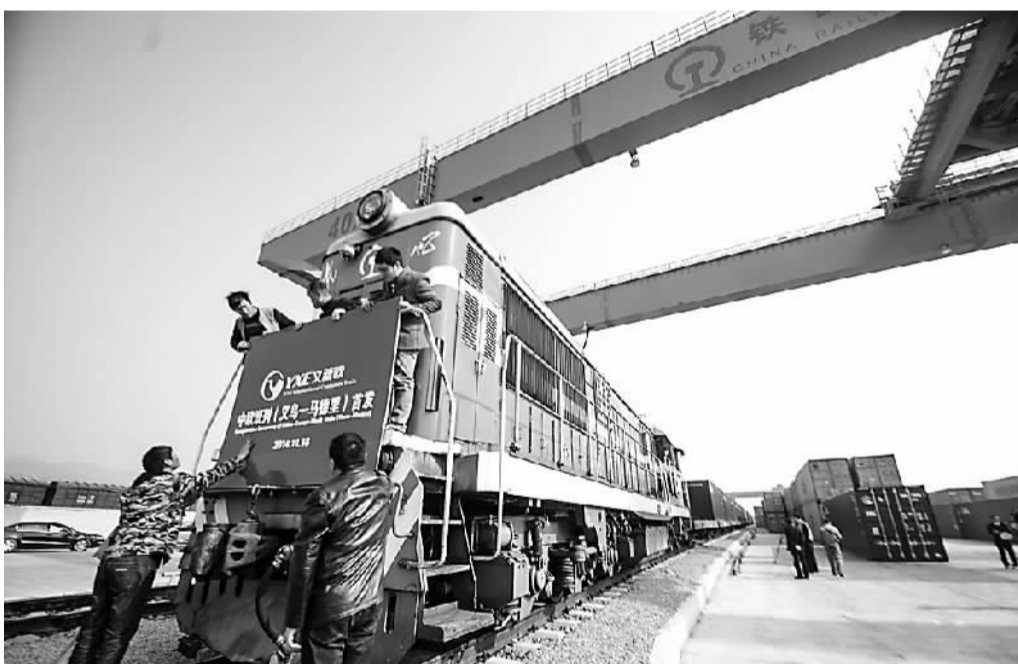
在浙江义乌，工作人员为首班开行的“义新欧”（义乌—新疆—马德里）国际货运列车挂上标牌。

海陆空全方位升级，展现出三亚积极融入“一带一路”战略、打造国际旅游精品城市的雄心。