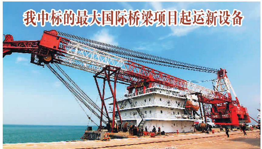
4月15日，浮吊船“瑞航05”从青岛港驶向孟加拉国，这是我国中标的最大国际桥梁项目孟加拉国吉大港帕德玛大桥主桥建造工程的新设备。浮吊船全长99米，宽29米，最大吃水5米，最大起重重量1000吨。图为4月15日，停泊在山东青岛海西起重机有限责任公司码头的“瑞航05”轮在办理海关通关手续。

在此形势下，本届广交会也提出将紧紧围绕“稳中求进、创新发展”的总基调，为外贸稳增长、调结构和推动我国由贸易大国向贸易强国迈进做出贡献。