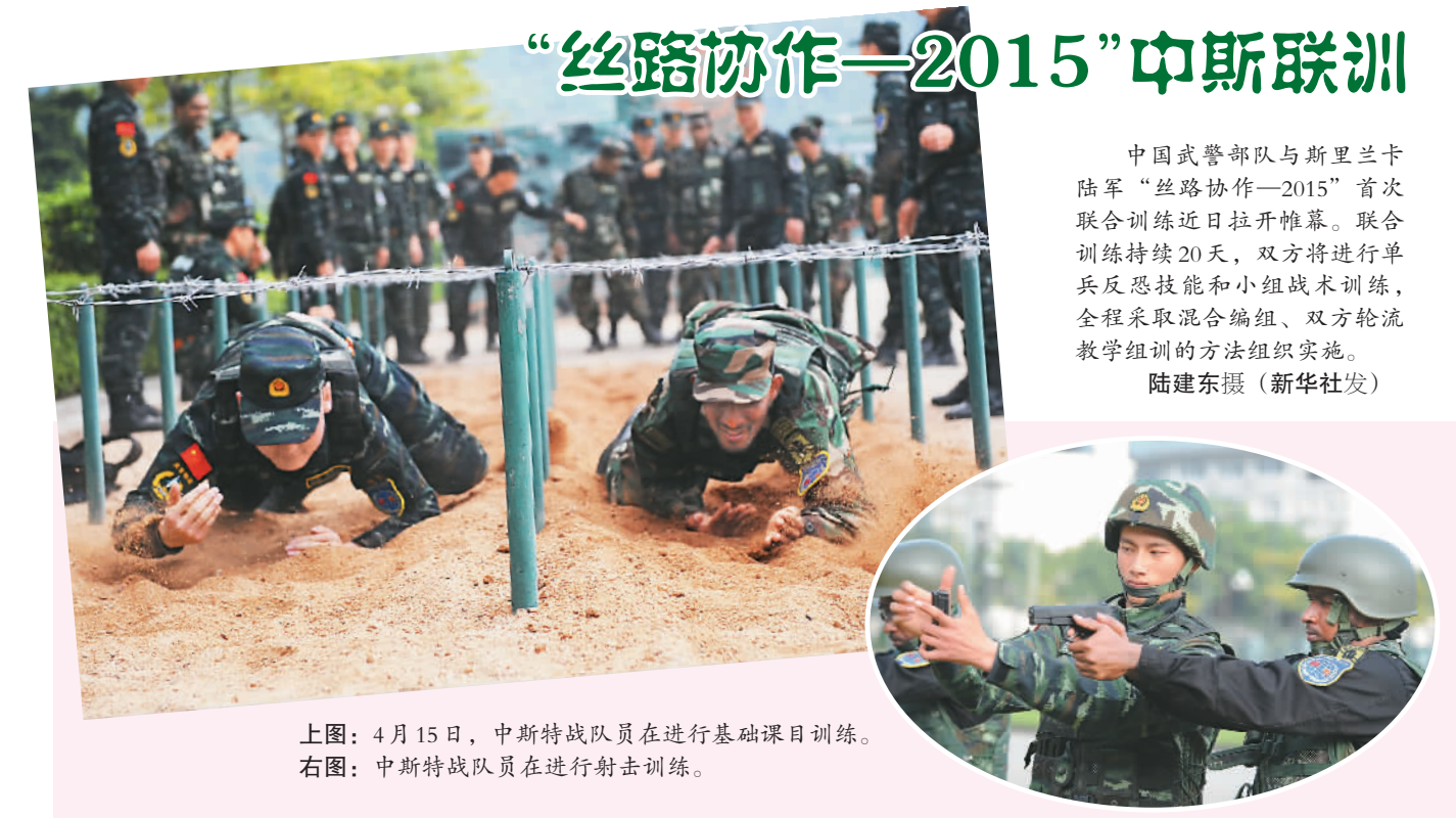
上图：4月15日，中斯特战队员在进行基础课目训练。