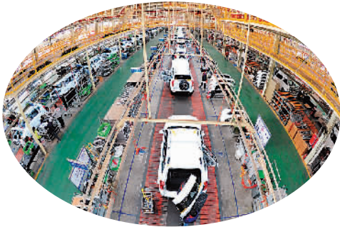
图为北汽集团华北（黄骅）汽车产业基地生产线。

“从出口看，4.9%的增速和去年、前年同期持平，随着欧美等经济体的缓慢复苏，预计出口不会进一步下降。从投资来看，‘一带一路’、新型城镇化等战略正在推动我国基础设施的持续改善和城市建设水平的提高，这有利于投资稳定增长。从消费来看，10.8%的增速还是相当平稳的，而就业、居民收入目前的增长势头也将对其形成稳定支持。”张立群分析。