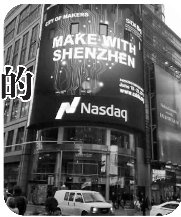
深圳“创客之城”巨幅广告亮相美国纽约时代广场。

创客的聚集、创客文化的兴起是深圳这座“创新之城”最时尚的表征。数据显示，2014年，深圳PCT(专利合作条约)国际专利申请量达到1.16万件，同比增长15.9%，连续11年居全国各大城市之首。