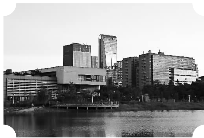
深圳科技园聚集了腾讯等一大批创新型企业。

深圳创新活动的活跃还得益于深圳发达的金融产业。深圳是中国创投之都，全国1/3的创投机构和创投资本都在深圳，其中不乏面向创客的创投机构。