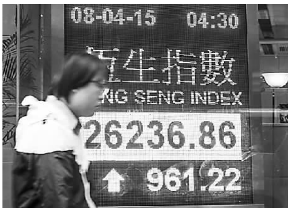
4月8日，行人从香港湾仔一家银行的恒生指数电子显示屏前走过。