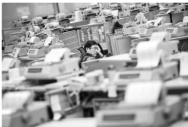
4月8日，一名出市代表坐在香港交易所交易大厅内。

应提高额度的讨论。对此，香港特区政府财政司司长曾俊华12日表示，沪港通的额度并非目标，而是风险管理工具，防止市场出现过热。过去一星期，单日额度有效发挥了它的风险管理作用。