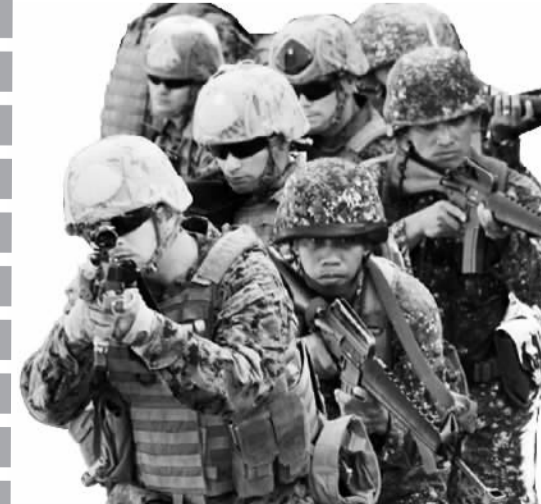
资料图片:美菲两国陆战队进行联合演习。

地距离中国黄岩岛仅220公里。据澳大利亚《悉尼晨锋报》4月9日报道,澳也在为参加此次靠近南海争议海域的演习部署军事人员。