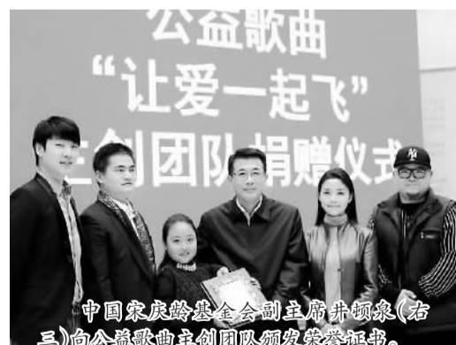
中国宋庆龄基金会副主席井佩泉(右三)向公益歌曲主创团队颁发荣誉证书。

9日,中国宋庆龄基金会国际孤独症日公益歌曲“让爱一起飞”主创团队捐赠仪式在宋庆龄故居举行,一直坚持关爱孤独症儿童慈善工作的主创人员及众多爱心人士出席活动。