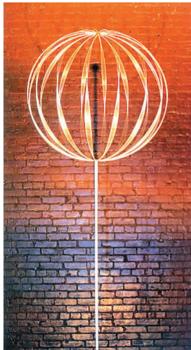
北京的地球 beijing globe 1997 蔡文颖

蔡文颖是一位画家、工程师和雕塑家，他自20世纪60年代起就开始创作由电子和计算机控制的雕塑。蔡文颖对世界的贡献，在于他能用他开创的动感雕塑（cybernetic sculpture），捕捉和再现大自然的辉煌。蔡文颖的作品已经在世界各地的一流博物馆展出并被收藏，其中包括纽约的现代艺术博物馆、巴黎的蓬皮杜中心和伦敦的泰德美术馆。他的雕塑利用金属、玻璃纤维和光，来重现植物状的有机形体，在颤动和炫目中，配合周围环境中的声音和音乐翩翩起舞。蔡文颖以华