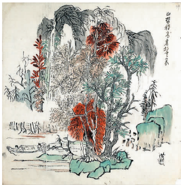
临古画稿之陈洪绶（黔斋基金会藏） 黄宾虹