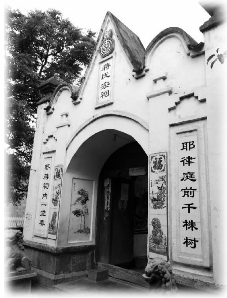
具有契丹风格的蒋氏宗祠

专家们也提出了各自的建议。如北京文物考古研究所前所长齐心表示，施甸在展示契丹后裔文化时要“见物见人”，用文物说话，让特色习俗吸引人。黑龙江齐齐哈尔市达斡尔学会会长吴焕年认为，施甸旅游的发展还需要搞好对外的交通连接，把自身融入于云南这个旅游热门地点的大环境，让游客能够来了云南“想来施甸、容易来施甸”。