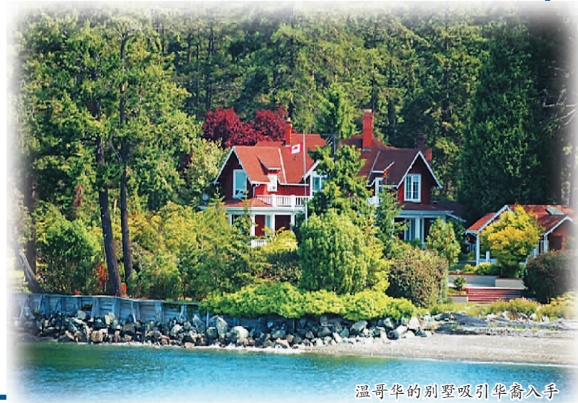
温哥华的别墅吸引华裔入手

在2009和2010年出售的两处房产虽然拥有时间不长，但每次出售都有特殊原因，并不像在炒房，所以从中所得属于资本增值；同时由于该两物业均属他正常居住的住所，房屋买卖利润应属免税的资本增值。最后，税局撤销了罚款决定。有税务专家认为，为避免这样的麻烦，纳税人应注意的事项包括：换房不要太频繁，否则可能被定性为炒房，炒房应按生意收入报税。 （摘自加拿大《世界日报》）