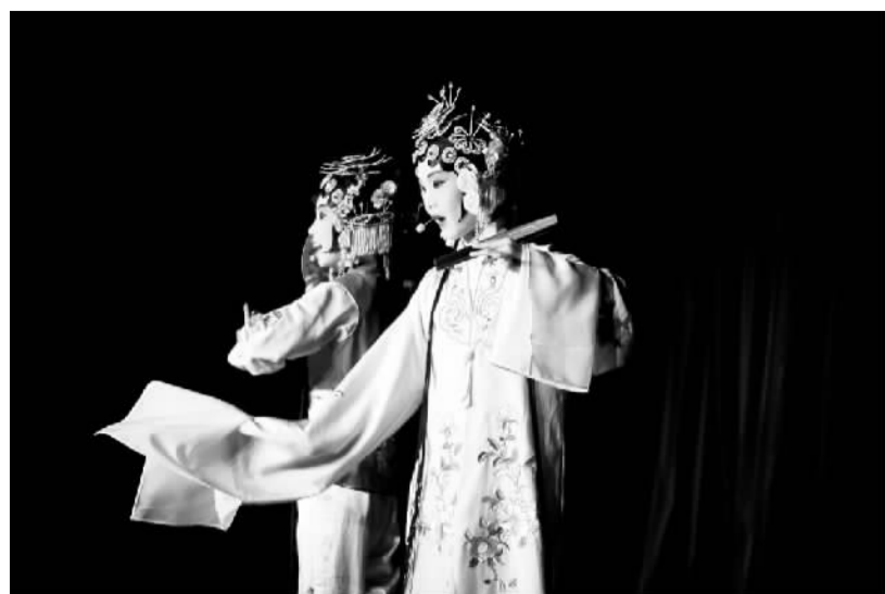
亭·游园 区实验小学：《牡丹》 江苏昆山开发