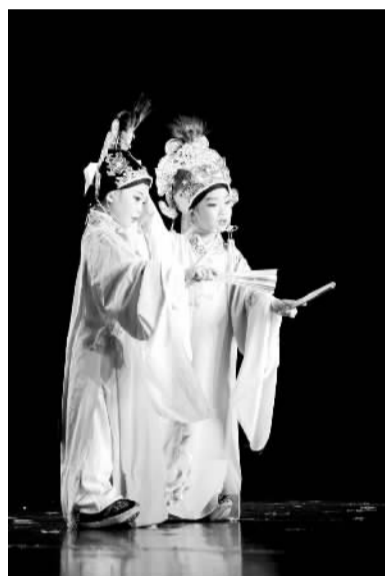
▲南京青年越剧艺术团小 花班：《越吟童心梦》

“借此机会，向参加演出的孩子们和家长老师表示欢迎和祝福。祝你们演出顺利，访问成功，祝羊年吉祥如意！”驻马塞总领事余劲松用一句祝福为演出拉开帷幕，身后的朋友早已按捺不住，跃跃欲试，来自中法两国的观众也都备好相机、充满期待。地中海皇家剧院此时一片热闹和喜庆，这是“2015中国青少年文化使者荣耀出访”暨中法青少年艺术交流盛典的演出现场。来自中国十几个省市的百余名青少年使者齐聚于此，为中法两国的观众献上一场精彩纷呈演出。