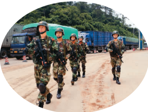
友谊关边检站官兵在口岸巡逻

山水相连，血脉相亲。作为中国唯一与东盟国家既有陆地接壤又有海上通道的省份，广西连续13年成为东盟第一大贸易伙伴。广西边防总队所属边防检查站通过加强边检国际执法合作，提高服务质量，改善通关环境，助力广西经济发展和对外交流合作，