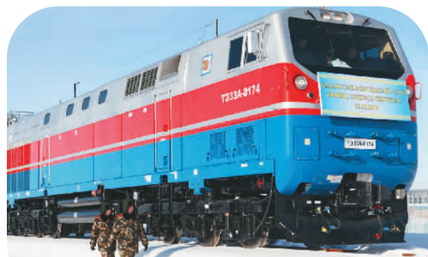
霍尔果斯边检站官兵在铁路口岸执勤

该站充分发挥微信平台快速准确、简单易用的优势，通过微信平台及时了解口岸入境人员动态信息，有针对性地对出入境旅客进行预查询，将边检的服务工作延伸至限定区域以外。