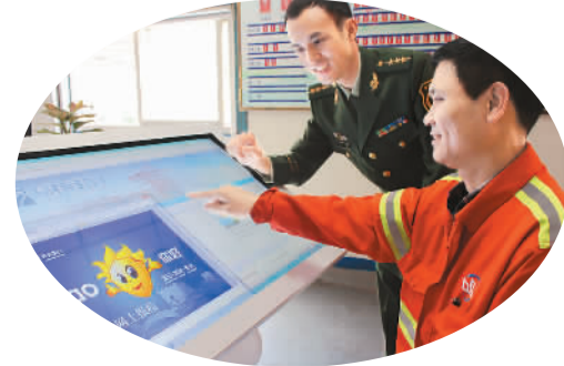
泉州边检站网上报检方便快捷

泉州边检站斥资150余万元建设多媒体培训室，建成海港业务与空港业务兼容的模拟学习平台，满足检查员日常培训、考核需求。