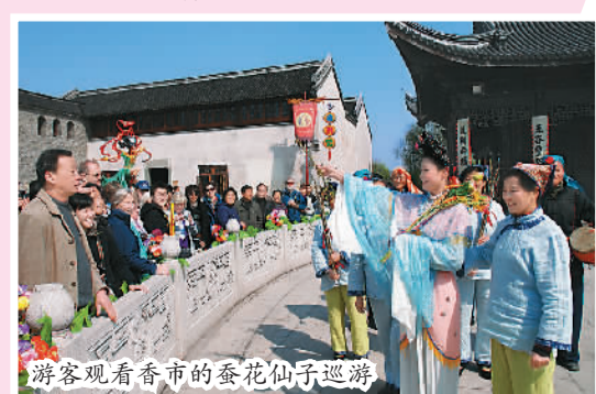
游客观看香市的蚕花仙子巡游

市期间的茶艺街美食广场呈现各式清明小吃。青团、南瓜团、麦芽饼、猫耳朵、熏豆茶这些乌镇特色的小吃自是不必说；野菜烧卖、菜年糕、咸肉菜饭也是春日必尝。而乌镇自制的酱鸭翅、酱鸭脖、酱鸭腿等美食更是颇受欢迎。