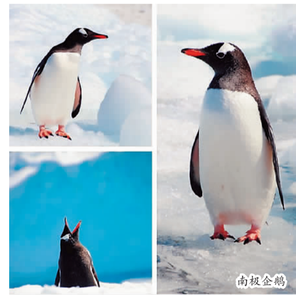
中国游客到达南极