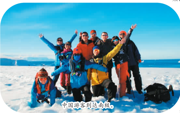
中国游客到达南极