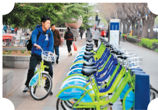
图为4月1日，北京大兴区的一位居民在使用公共自行车出行。

为倡导绿色出行、缓解交通拥堵，北京市交通委路政局城市道路养护中心副主任殷远飞表示，今年北京将再新增1万辆公共自行车，总量达到5万辆