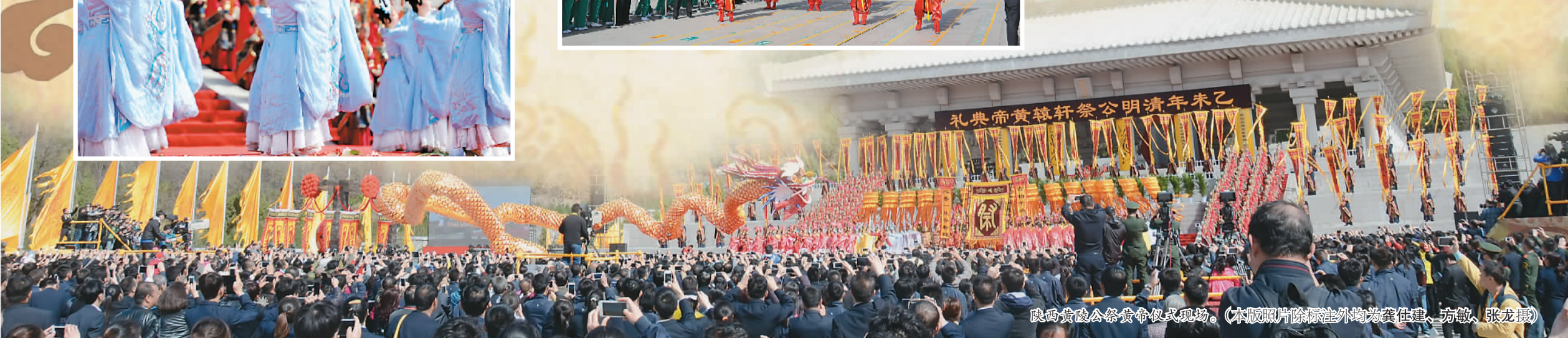
陕西黄陵公祭黄帝仪式现场。