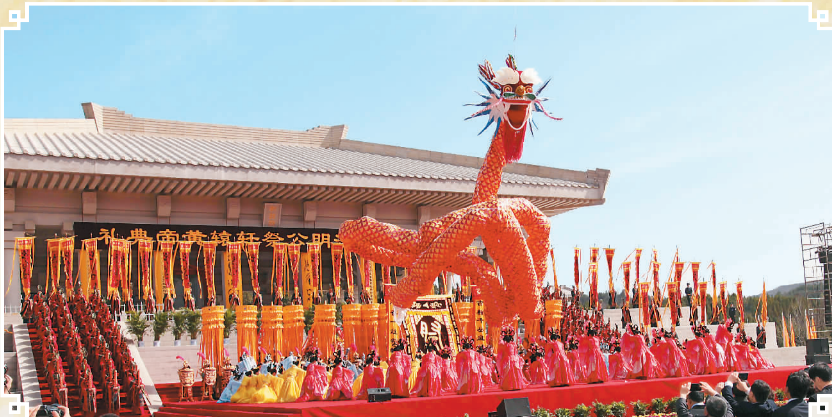
陕西黄陵乙未年清明祭祀轩辕黄帝仪式现场。

穿过轩辕桥，登上龙尾道，4月5日上午，万余名海内外中华儿女的代表，满怀虔诚之情齐聚于陕西省黄陵县的轩辕殿祭祀广场，隆重举行乙未年清明公祭轩辕黄帝典礼。而在此前的4月2日，安徽黄山轩辕峰下的黄帝文化广场，当地黄帝文化研究学者和群众2000余人也举行公祭轩辕黄帝仪式，追念人文初祖功德，表达炎黄子孙的追思。