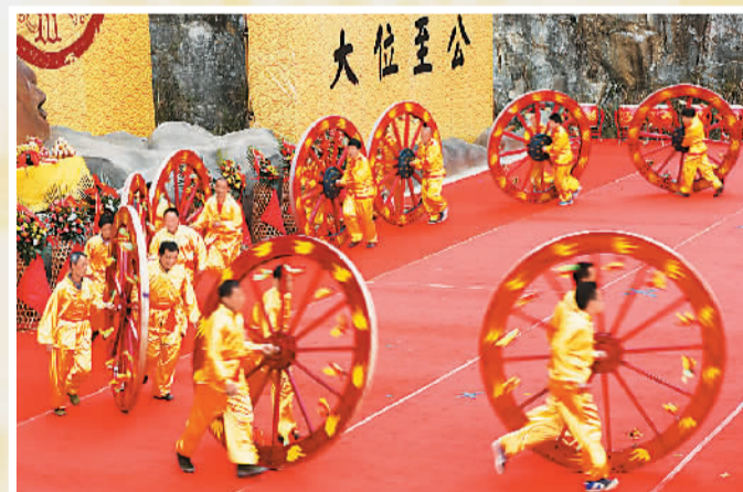
安徽黄山公祭黄帝仪式上的民俗表演。