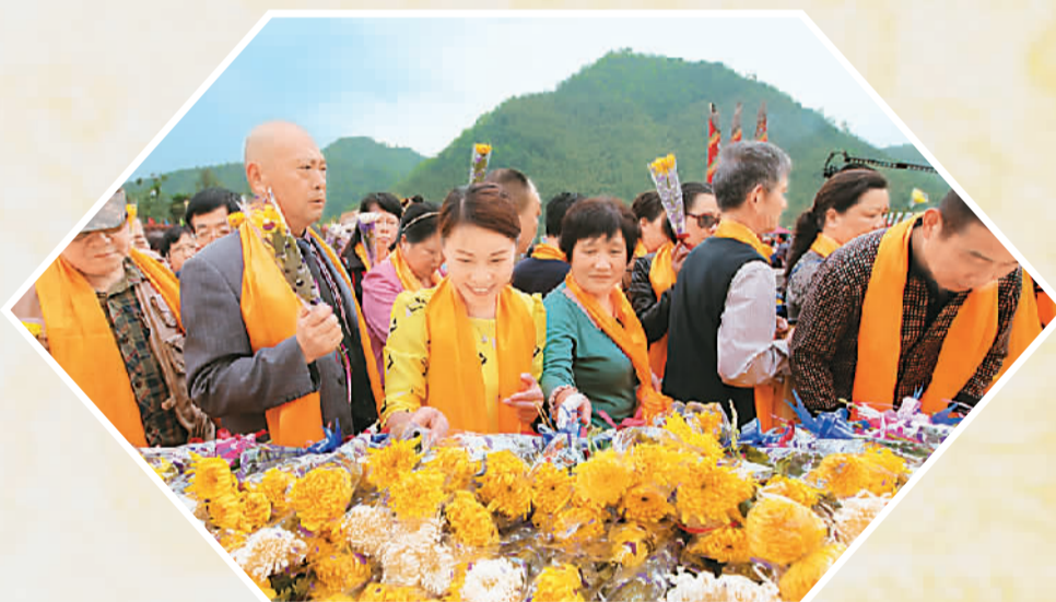
在安徽黄山，祭祀者在黄帝祭祀广场公祭轩辕黄帝。