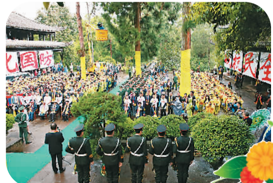
▲社会各界500多位代表在云南腾冲国殇墓园缅怀抗日英烈。