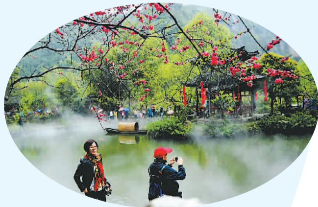
清明假期，人们走到户外踏青赏绿，尽情享受美丽春光。图为游客冒雨游览重庆市酉阳桃花源。