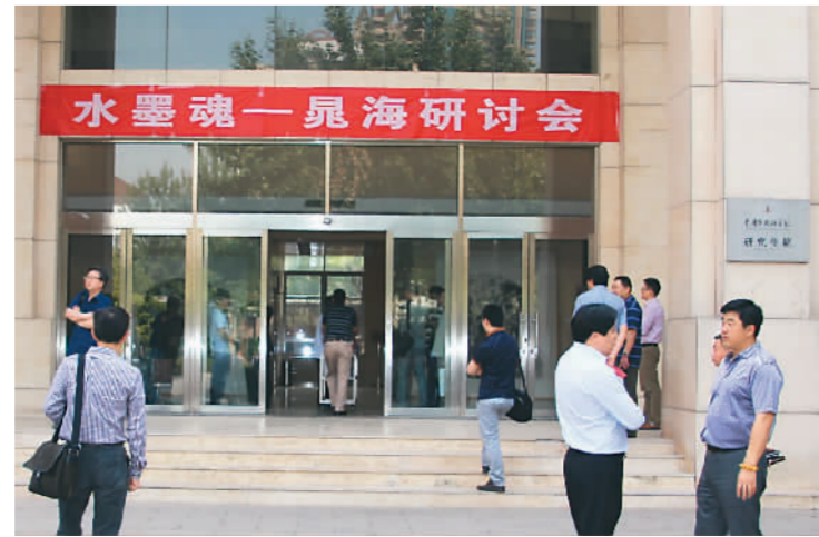
中国艺术研究院内研讨会外景