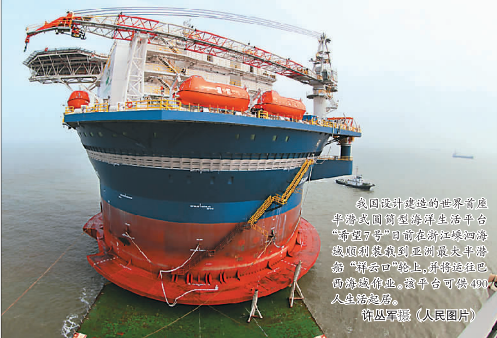
我国设计建造的世界首座半潜式圆筒型海洋生活平台“希望7号”日前在浙江嵊泗海域顺利装到亚洲最大半潜船“祥云”轮上,并将运往巴西海域作业。该平台可供490人生活起居。

阳春三月,喜马拉雅山脉腹地连降大雪,部分地区积雪厚度达到3米左右,气温骤降至零下18摄氏度。连日来,西藏阿里军分区普兰边防连加强边境管控力度,采取乘马与