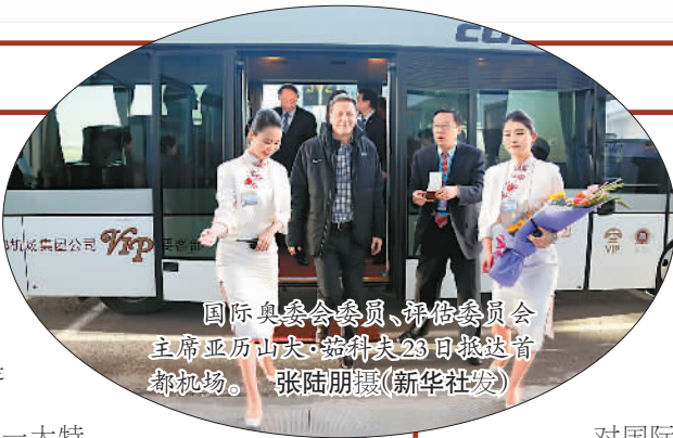
国际奥委会委员、评估团委员会主席亚历山大·洛佩兹23日抵京首都机场。

在方力看来,申办冬奥会的过程中,我们的生活也会有潜移默化的改变。“冬季项目的推广,让更多人投身大自然,养成体育锻炼的习惯。公众的环保意识有所提升,环境的改善需要政府倡导更要有公众参与,希望每个人切实行动起来。在经济发展与生态文明之间,将有很多新探索、新成果,使我们的家园更加绿色环保、可持续发展。”