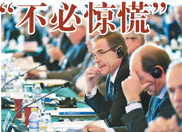
图为与会的外国代表在听取嘉宾发言。

下降,但是由于教育程度的提升,人力资本总量仍处于上升态势,到2023年前后才达到峰值。