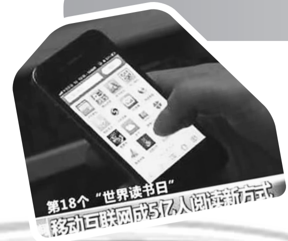
第18个“世界读书日” 移动互联网成为全民阅读新方式