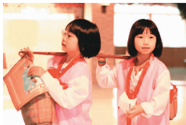
图为小朋友在辅导员的指引下完成扁担挑货物的任务。

“党和政府近年来一直在大力推进社会主义文化建设，但社会主义文化不是空中楼阁，而是植根于中国传统文化的土壤中；只有让更多的孩子学习中国优秀的传统文化，懂得做人的道理，中国的崛起才不会是一句空话。”他透露，一所更大的“东湖小镇”将于今年在广州老城区落户，而澳大利亚或将迎来海外第一家“东湖小镇”。可以肯定，更多类似“东湖小镇”这样的儿童培训机构，将作为中国传统文化传承的驿站不断涌现出来。