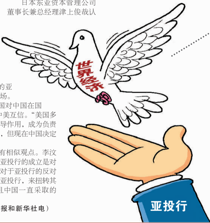
(综合本报和新华社电)

中方表示,欢迎卢方的决定。作为亚投行意向创始成员国首席谈判代表会议的主席,中方正根据多边程序征求现有意向创始成员国的意见。如顺利通过,卢森堡将正式成为亚投行意向创始成员国。