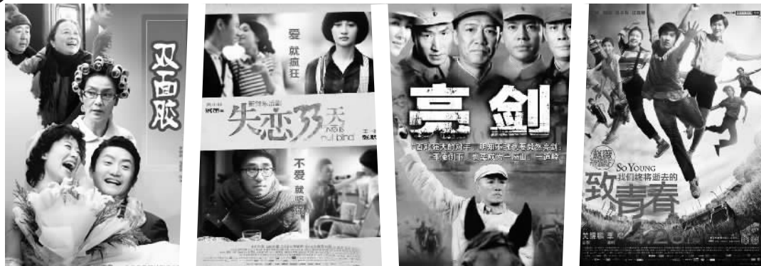
这些剧也是根据网络文学作品改编创作的

日前，国产电视剧《何以笙箫默》在江苏卫视和东方卫视首播，引发追剧热潮。《何以笙箫默》改编自知名网络小说作家顾漫的同名小说。顾漫于2003年在晋江原创网上以连载的形式刊载该文，历时两年左右才完稿，期间吸引了大量的读者。