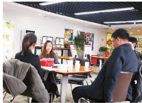
学生和家咨询留学事项

询机构时说道：“我在选择留学咨询机构时会更倾向于选择有海外留学背景的咨询师，因为有亲身经历的人，在制订方案的时候会更有经验，不仅能提供有关申请学校的建议，也能给我的孩子在国外的生活提供指导。”