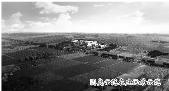
国奥示范农庄示范园

价值和品牌价值；其四，农庄还是食品安全信誉体系的新平台。目前食品安全问题令人堪忧，从国内外的实践来看，个人信誉是解决食品安全很好的途径。项目将通过农庄平台，建立食品安全的个人品牌信誉体系；其五，农庄是跨界产业整合平台，以农业为主题，将农业与旅游、文化、体育、养老等产业相结合，未来扎龙将成为美好生态、田园生