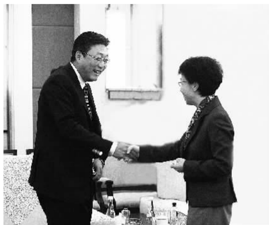
APEC赞助签约仪式上，北京市副市长陈红（图右）会见国奥集团董事长张敬东

城镇化是伴随工业化发展、非农产业在城镇集聚、农村人口向城镇集中的自然历史过程，是人类社会发展的客观趋势，是国家现代化的重要标志。改革开放以来，伴随着工业化进程加速，我国城镇化经历了一个起点低、速度快的过程。