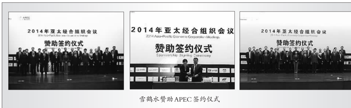
雪鹤水赞助APEC签约仪式