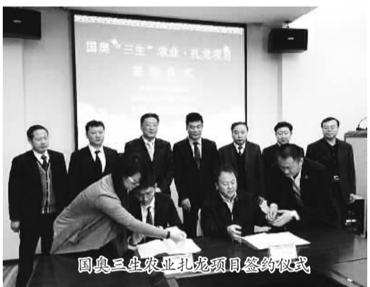
国奥三生农业扎龙项目签约仪式

城镇化是伴随工业化发展、非农产业在城镇集聚、农村人口向城镇集中的自然历史过程，是人类社会发展的客观趋势，是国家现代化的重要标志。改革开放以来，伴随着工业化进程加速，我国城镇化经历了一个起点低、速度快的过程。