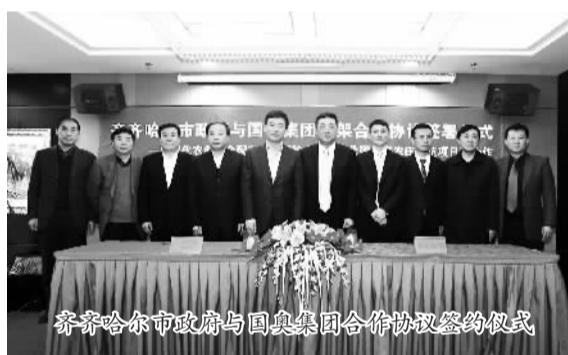
齐齐哈尔市政府与国奥集团合作协议签约仪式

国奥一直以来所秉持的城市运营理念可以总结为五点。顺势而为：顺应国家政策，走在改革发展前段；资源整合：优化资源配置，搭台唱戏；产业引擎：有限产业规划，带动整体发展；品牌塑造：