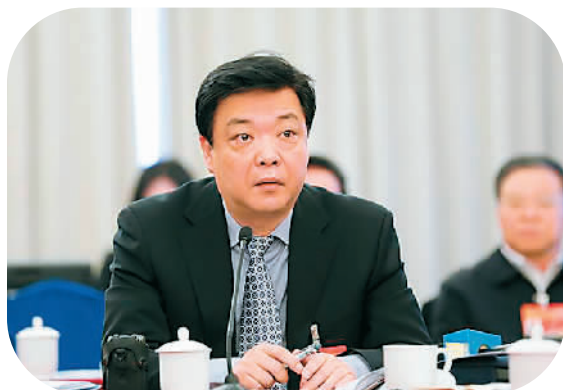
3月4日,全国政协委员、北京市政协主席吉林在全国政协十二届三次会议中共界别小组会议上发言。

极。“在过去,资源过度向北京集中,这不仅限制了津冀的发展空间,也让北京自身不堪重负。未来,随着京津冀协同发展顶层设计的出台及落实,生产要素及产业将在整个区域内更合理地分布,从而释放出强大的经济增长动力。”杨松说。