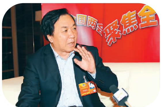
图为全国政协委员、河北省沧州市政协副主席何香久。