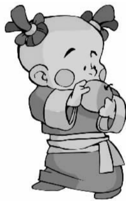
山西等地有惊蛰吃梨的习俗

中国人表达恨意，往往用“吃你的骨头喝你的血”这样的措辞。对于害虫的恨，过去的民俗也爱用吃掉来表达。